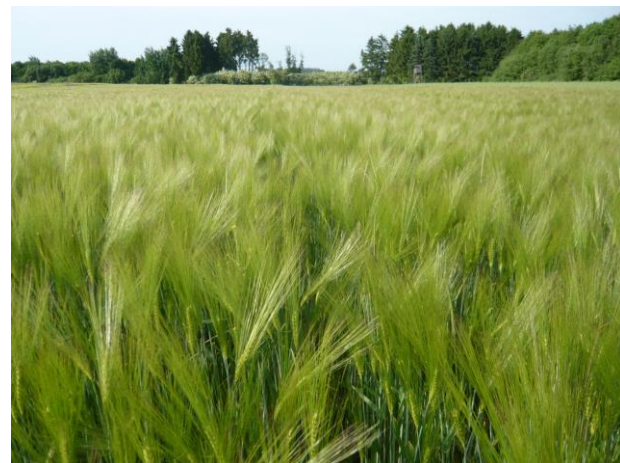
Wintergersten-Stamm HS 114-10 (Cayu) mit hoher Ertragsfähigkeit, Unkrautkonkurrenz und Winterhärte

4 ) nach BSA: ++++ = sehr hoch, o = mittlere Ausprägung, --- = sehr gering