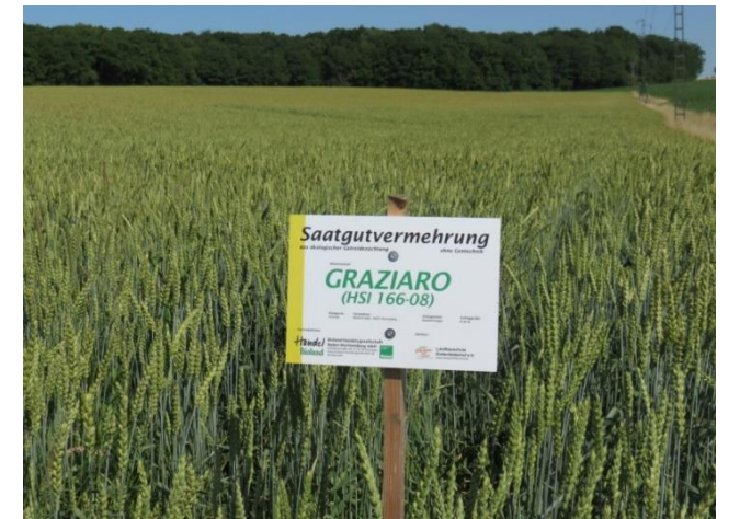
GRAZIARO: Sehr ertragsstarker Qualitätsweizen mit Resistenz gegenüber Stein-, Zwergstein- und Flugbrand. OBEG 2015

ARISTARO (HSI 88-07): BSA-Zulassung als E-Weizen 2016. Steinbrand- und Zwergsteinbrand-resistenter Qualitäts-Backweizen mit Ähren-Begrannung. Durchschnittlicher Ertrag bei sehr hoher Backqualität. Standfest bei mittlerer Wuchslänge, gute Unkrautunterdrückung, hohe Blattgesundheit bei geringer Flugbrand-Anfälligkeit, winterhart. Besondere Eignung für Wildschwein gefährdete Standorte.