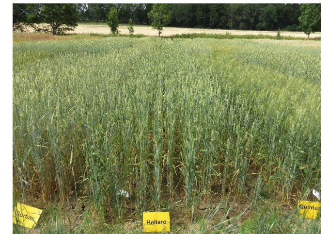
HELIARO mit Vergleichssorten im Landessortenversuch Maßhalderbuch 2015